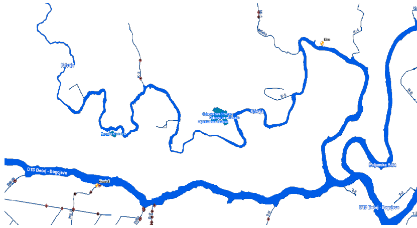
Слика 21. Површинске воде на територији Општине Србобран